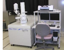
走査型電子顕微鏡