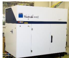
高集束レーザー加工装置