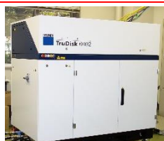
高集束レーザ加工装置