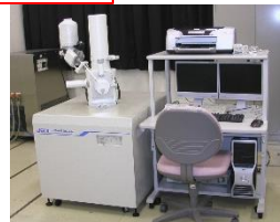
走査型電子顕微鏡