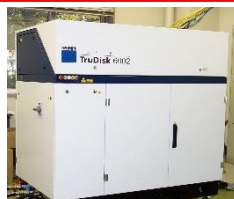
高集束レーザ加工装置