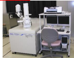
走査型電子顕微鏡